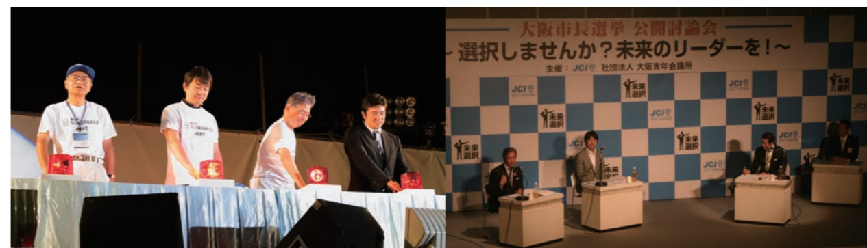
11月 大阪市長選挙公開討論会