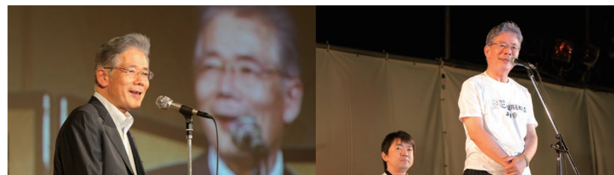
8月 なにわ淀川花火大会