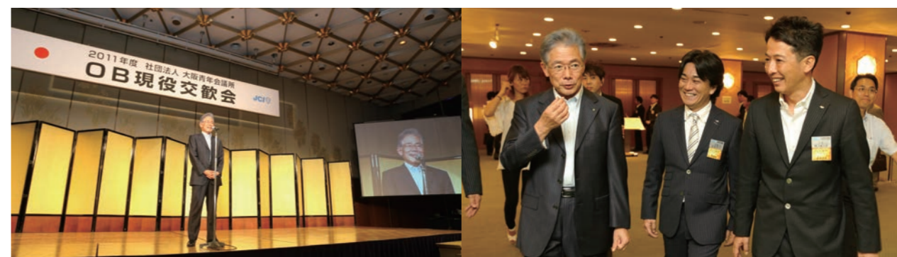
7月 OB 現役交歓会